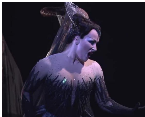
“La Regina della Notte” dal Flauto Magico