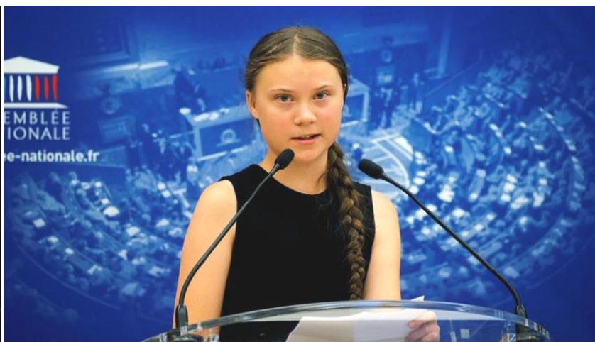
“Cambiamenti Climatici” e “Transizione Ecologica”