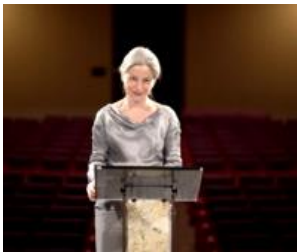
“Dichiarazione Universale dei Diritti Umani”