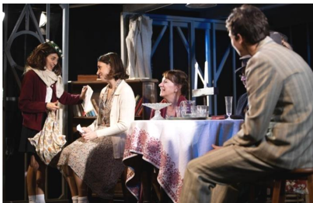
“Il Diario di Anna Frank”