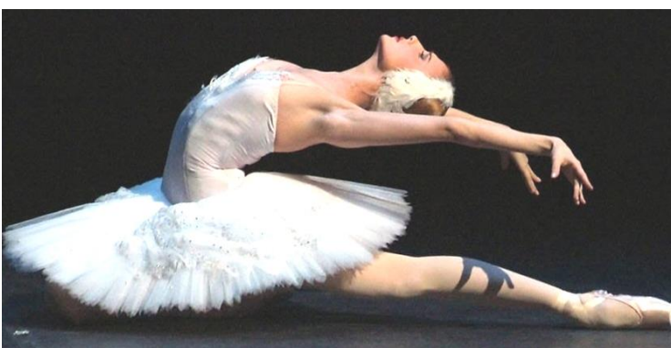
“La Morte del Cigno” di Saint-Saëns