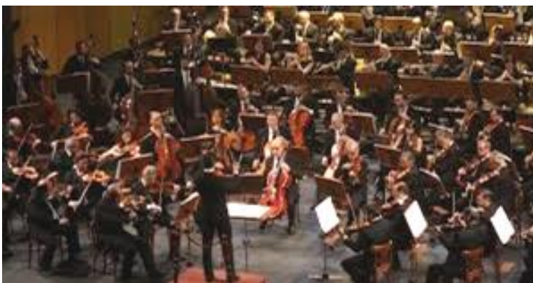
“Inno alla Gioia” di Beethoven