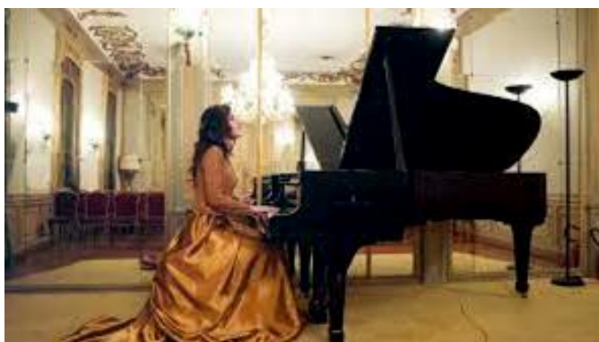
“Notturmi” di Chopin